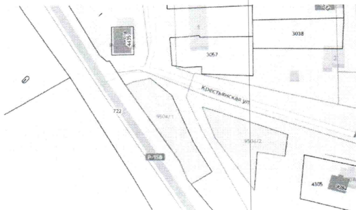
Рис. 3 – Местоположение земельного участка

Земельный участок для инвестиционного проекта (строительства) расположен по адресу: Республика Мордовия, Лямбирский муниципальный район, с.Лямбировь, ул. Крестьянская.»