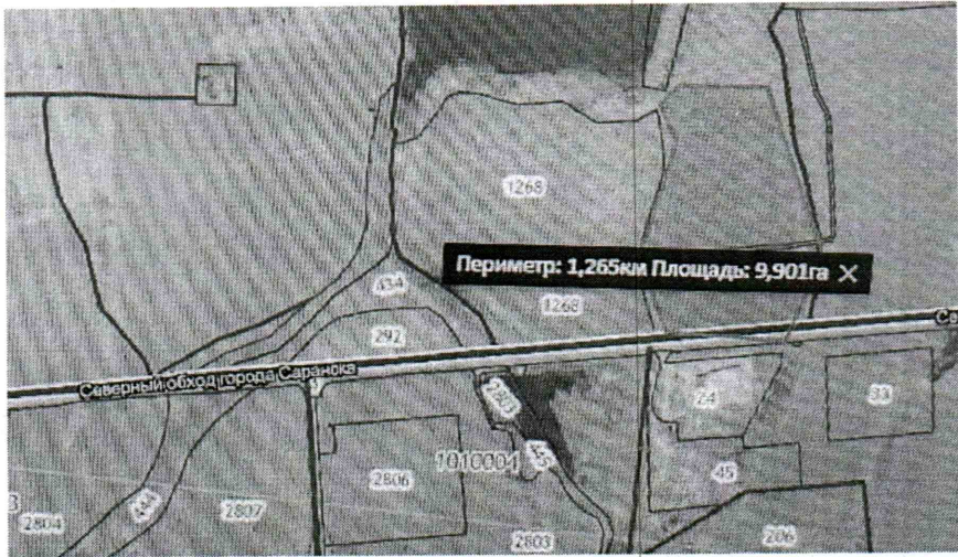
Рис. 1 – Местоположение земельного участка

сельскохозяйственного назначения. Общая площадь участка - 10 га.